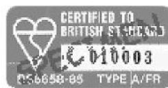
BS 6658-85 TYPE A/FR