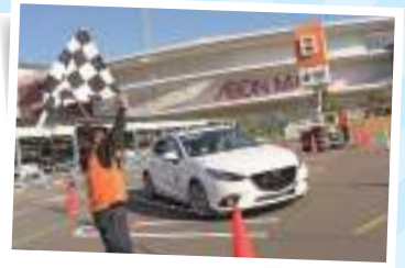
よくあるコースの例

「パイロン(マーカー)」で設定したコースを1台ずつ走って、ペナルティが最も少なかった人が優勝です。パイロンに接触したり、コースを間違えるとペナルティとなります。「運転の正確さ」を競うスポーツなので、特殊な運転技術より「ていねいさ」が大切です。