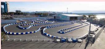
シティサーキット東京ベイ