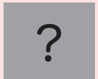
超大物ドライバー